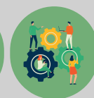
Metodología de proyectos